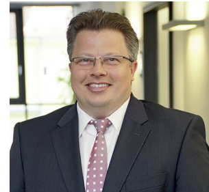
ConSalvo Finanz GmbH & Co. KG

versicherung, die den Verlust von Fähigkeiten, wie z. B. Gebrauch einer Hand, Knien/Bücken, Benutzung einer Tastatur, Autofahren etc., als Leistungsauslöser festgelegt hat. Die Grundfähigkeitsversicherung ist oft günstiger und hat eine weniger umfangreiche Gesundheitsprüfung. So finden wir für Sie eine individuell auf Ihre Situation angepasste Arbeitskraftabsicherung.